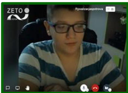
KLASA VII b