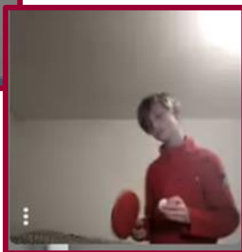
KLASA IV b