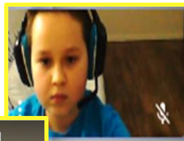
KLASA IV a